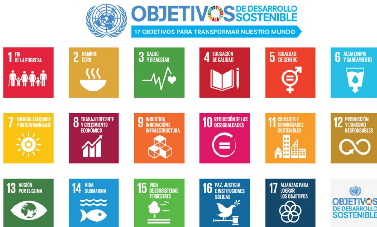
Ilustración 2.- Resumen Objetivos de Desarrollo Sostenible

.Fuente: Tomado de (Rodríguez de Da Silva & Cerviño, 2018).