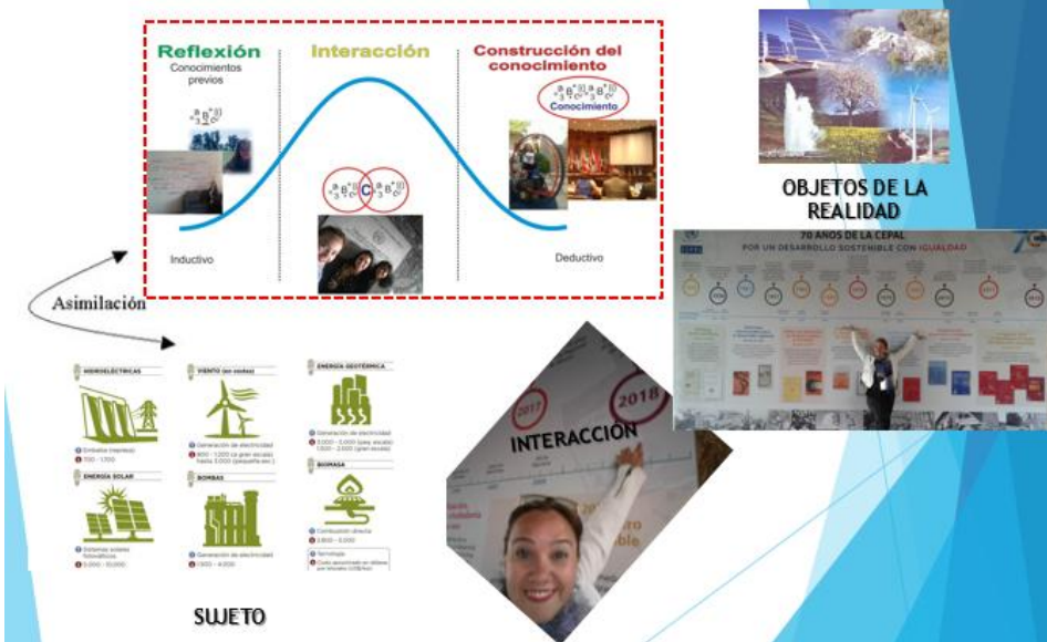
Ilustración 1.- Propuesta para la aplicación de la epistemología pluriparadigmática.

La construcción del objeto de estudio de la TD de la autora, en constante progreso así como la concepción de la sostenibilidad energética en Venezuela, transita por un enfoque pluriparadigmático, en aras de transitar por la intersubjetividad, avanzar a través de la fenomenología y llegar a la hermenéutica, trabajando entre el paradigma cuantitativo y cualitativo, al presentar cifras, explicadas a la luz de la intersubjetividad evidenciándose una visión inicial desde el constructivismo, cuando el autor Piaget, plantea concentrarse inicialmente, en la concepción del sujeto, para luego ser explicado como lo plantea (Lozada & Casas, 2008), desde un punto de vista fenomenológico con una travesía hacia la hermenéutica, con el enfoque permeado, con base en la intersubjetividad, considerando correspondiente el uso y aprovechamiento de la energía en lo que respecta a demanda, oferta y generación, lo cual debe ser asimilado a través del proceso de construcción del objeto de estudio, ilustrado de manera general en la Ilustración 1.- Propuesta para la aplicación de la epistemología pluriparadigmática. Ilustración 1.